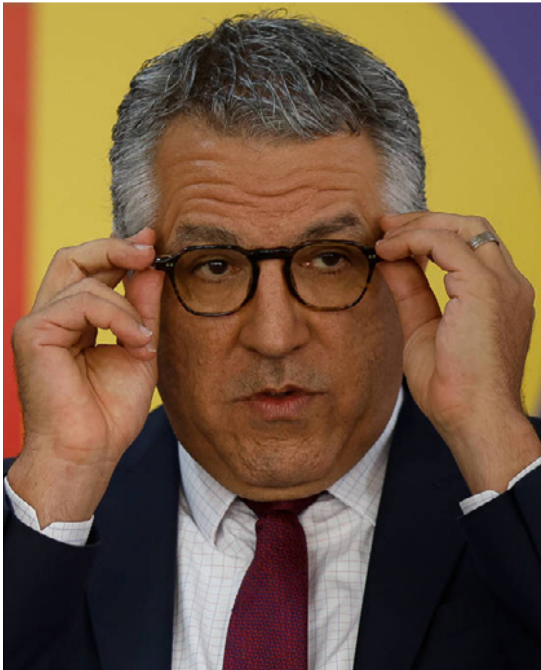
Alexandre Padilha: aliança partidária do governo Lula teve êxito nas eleições

Padilha minimizou o quadro, após reunião com o presidente Lula. “Lideranças que compõem essa frente ampla do governo, que apoiam o presidente Lula, que apoiaram o presidente Lula no primeiro, no segundo turno das eleições do ano passado [de 2022], derrotaram os ícones da extrema direita”, disse o ministro.