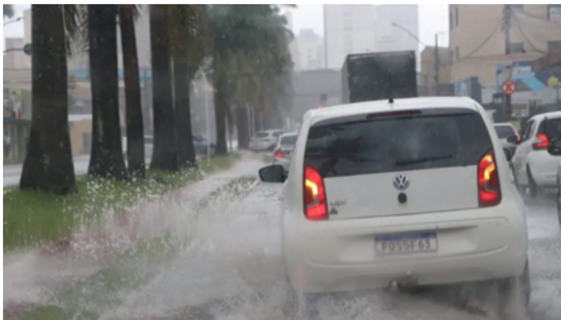
Cimehgo alerta que, a partir de quarta-feira (09/10), podem ocorrer tempestades com rajadas de vento

A expectativa de chuvas vem em um momento de intenso calor e baixa umidade em Goiás. O Cimehgo alertou que, nesta segunda-feira (07), a massa de ar quente e seco continuará a predominar em todas as regiões, mantendo as temperaturas elevadas e agravando a seca. A umidade relativa do ar deve cair para