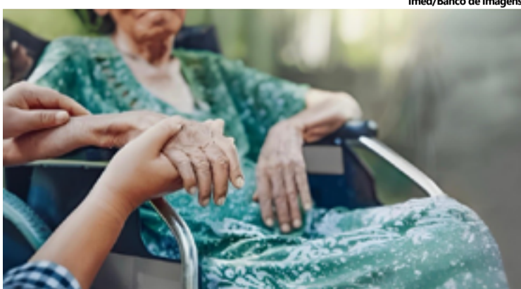
Cuidados na saúde são essenciais para um envelhecimento ativo e com bem-estar mental

Apesar de serem frequentes, esses problemas podem ser evitados ou minimizados por meio de um acompanhamento adequado e de práticas de promoção à saúde mental. A interação social, o apoio