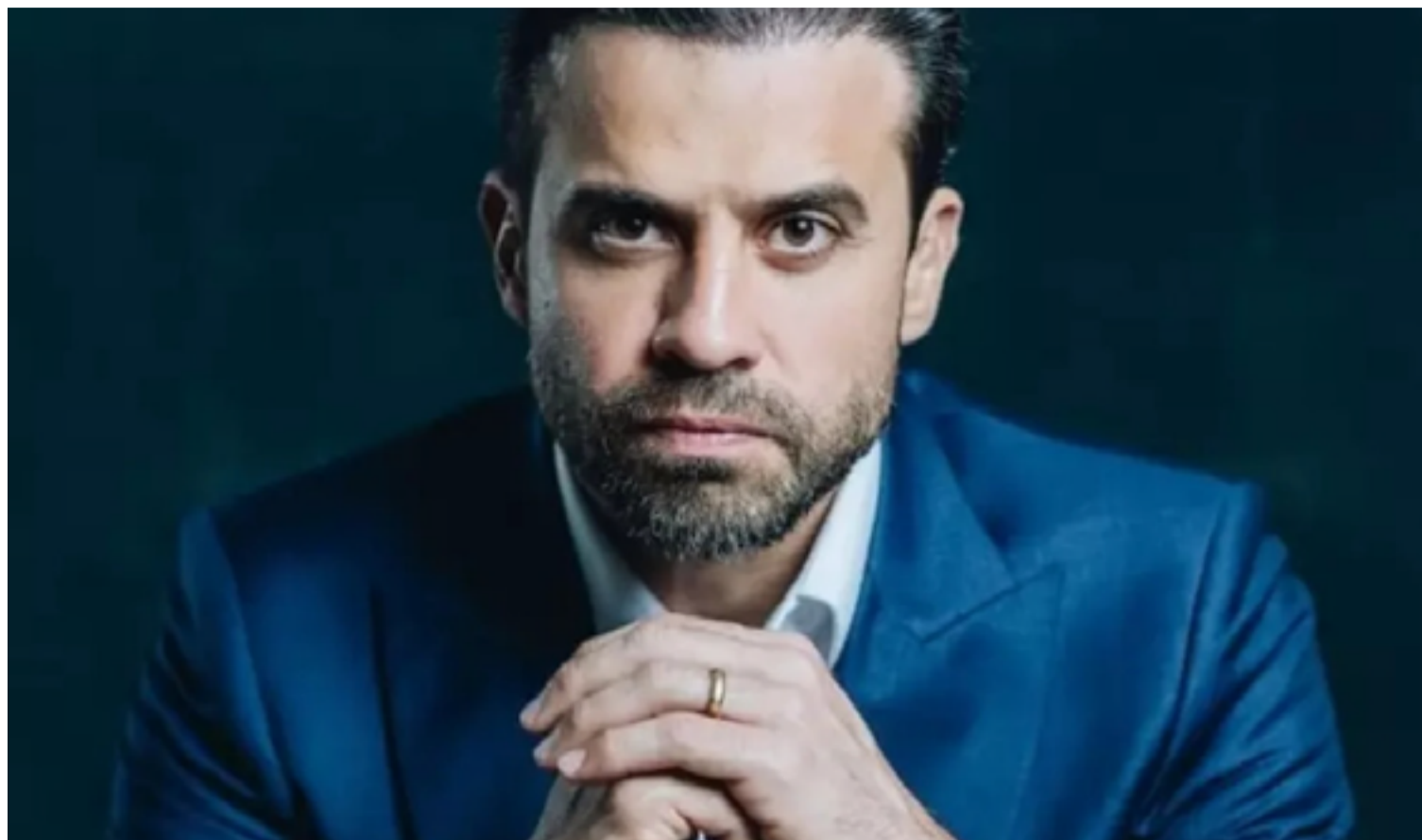
Pablo Marçal, ex-coach ficou magoado com a forma que foi tratado pelo ex-presidente Jair Bolsonaro

A publicação mais recente do ex-presidente no Facebook também traz diversos comentários críticos, com usuários se dizendo decepcionados com a falta de empenho do ex-presidente em criticar o que classificaram como censura às redes de Marçal --o candidato do PRTB teve perfis derrubados após divulgar laudo falso sobre