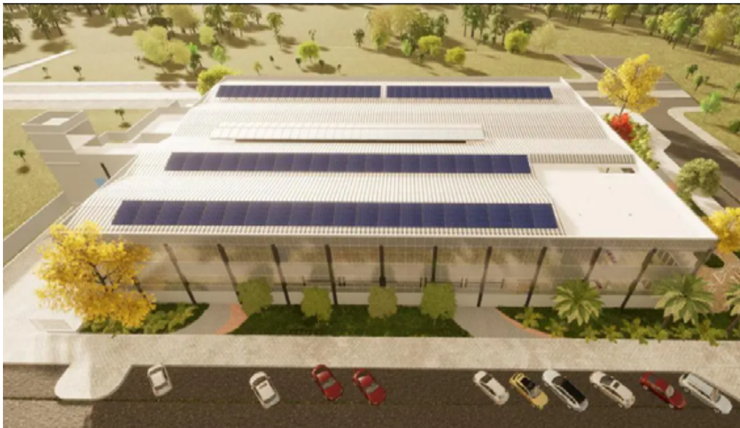
A previsão para a assinatura da ordem de serviços e início das obras é de 30 dias

Com um investimento de R$ 41,8 milhões, provenientes do Fundo de Proteção Social do estado de Goiás (Protege), o Mercado Goiano de Valparaíso terá ainda uma unidade do Vapt-Vupt, além de outros serviços públicos. Também proporcionará capacitação para empreendedores locais, bem como a promoção da gastronomia local, atraindo turistas, de modo a contemplar toda a população do entorno do Distrito Federal com uma infraes-