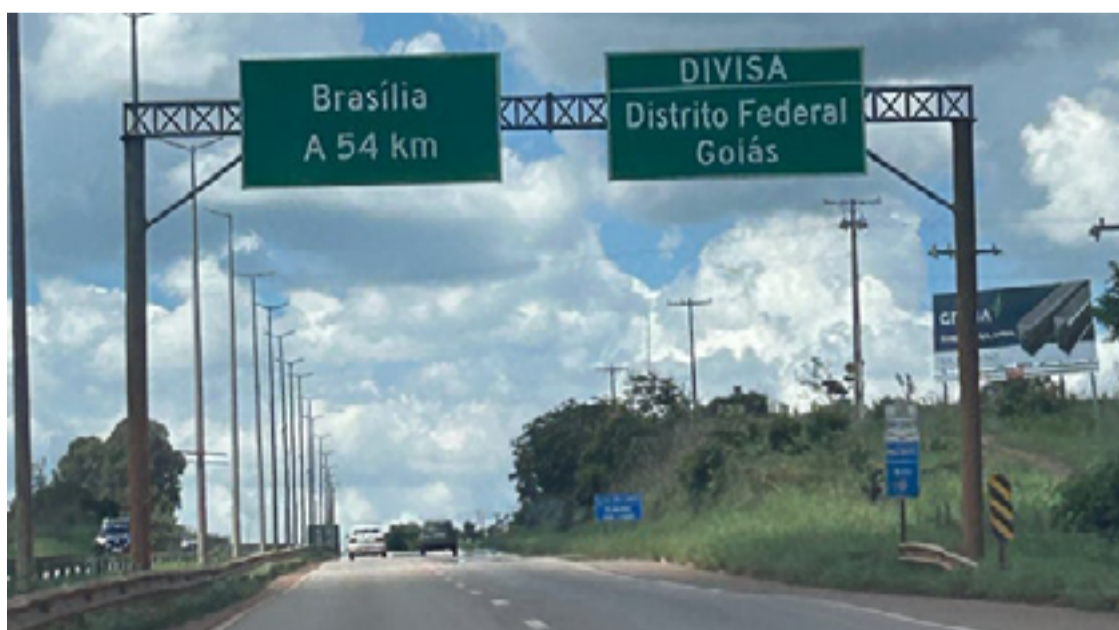
Esse domínio reforça uma tendência conservadora que vem ganhando espaço desde as eleições de 2018, como apontam especialistas