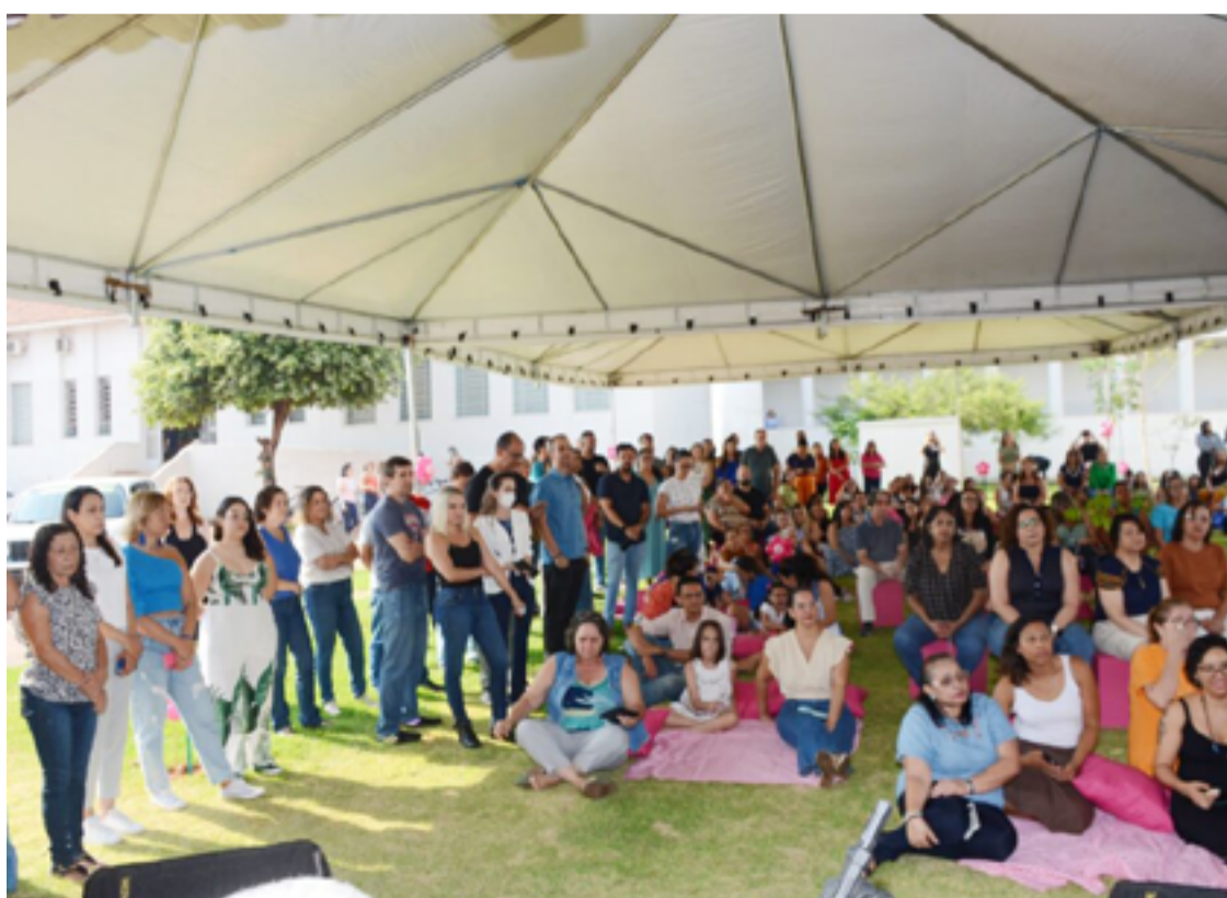
A programação incluiu apresentações de música ao vivo, bate-papo e um lanche especial