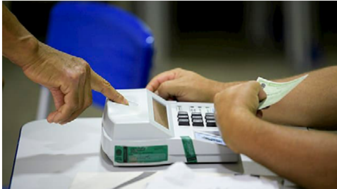
Contrato foi prorrogado indevidamente