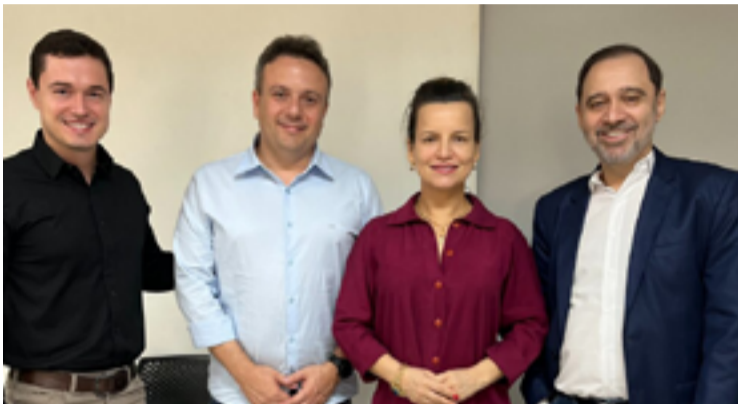
Colaboração entre instituições visa assegurar ética e transparência em operações financeiras

O encontro entre instituições teve como objetivo discutir estratégias de colaboração para fortalecer a fiscalização e o combate a irregularidades no setor contábil