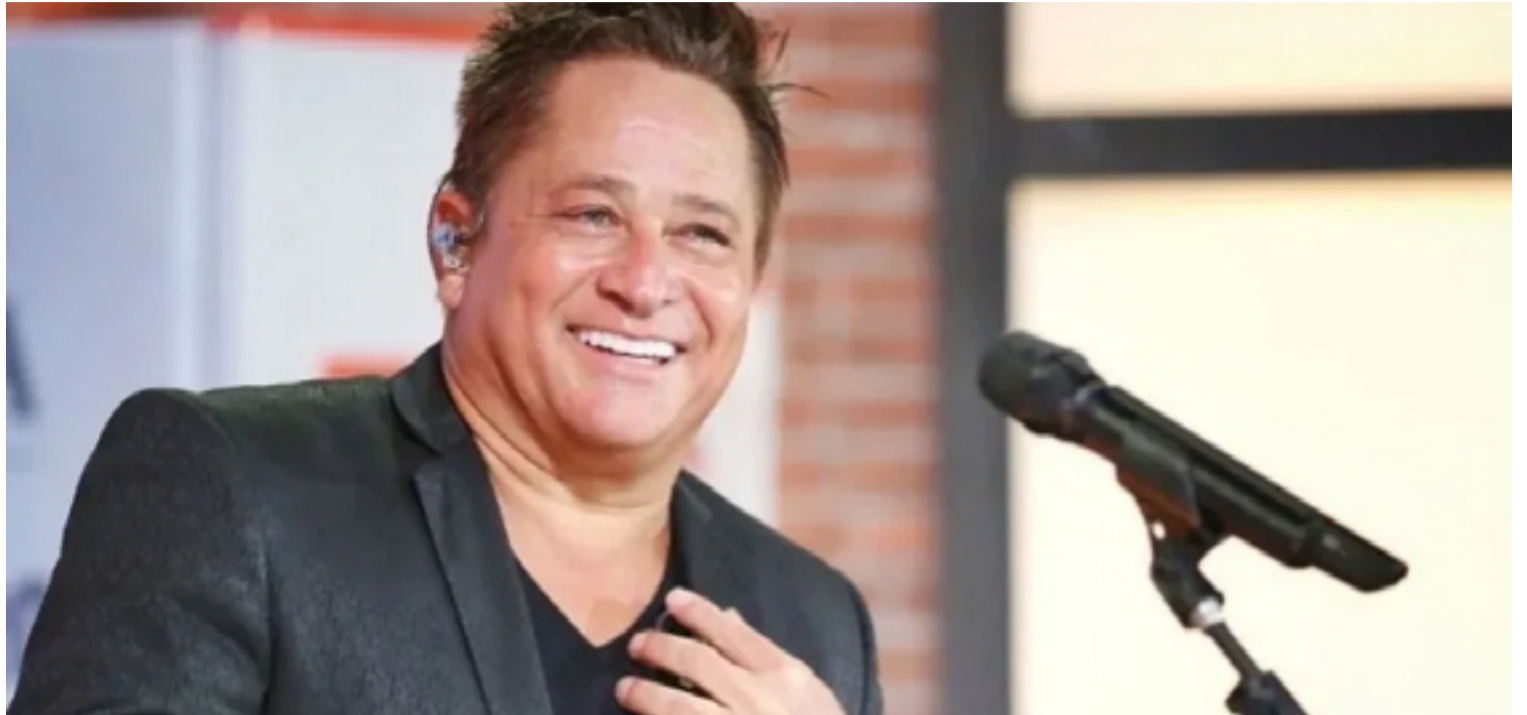
Em um vídeo nas redes sociais cantor se diz surpreso, nega as acusações e vê com tristeza a situação

A inclusão de Leonardo na lista se origina de uma fiscalização realizada em novembro de 2023 na Fazenda Talismã, localizada em Jussara, interior de Goiás. Durante a inspeção, foram encontradas seis pessoas, incluindo um adolescente de 17 anos, em condições degradantes, um dos fatores que caracterizam a escravidão contemporânea no Brasil. Essa não é a única propriedade do cantor e empresário, que também atua no setor de pecuária e recentemente investe na agricultura, especialmente no cultivo de soja.